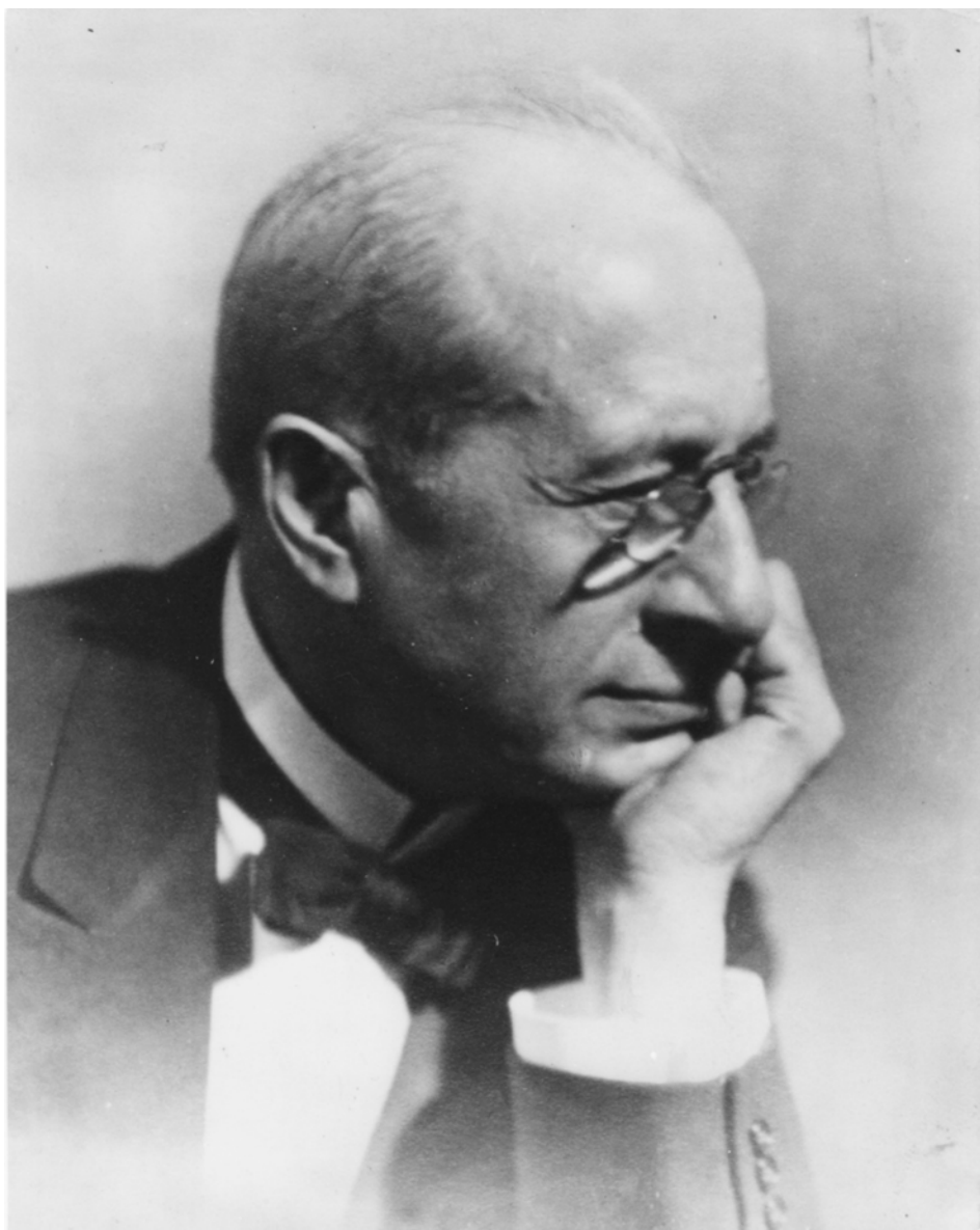
Aleksandr Ziloti (1863-1945) dirigió el estreno mundial del Segundo Concierto para piano de Rachmaninoff, con el compositor al piano.