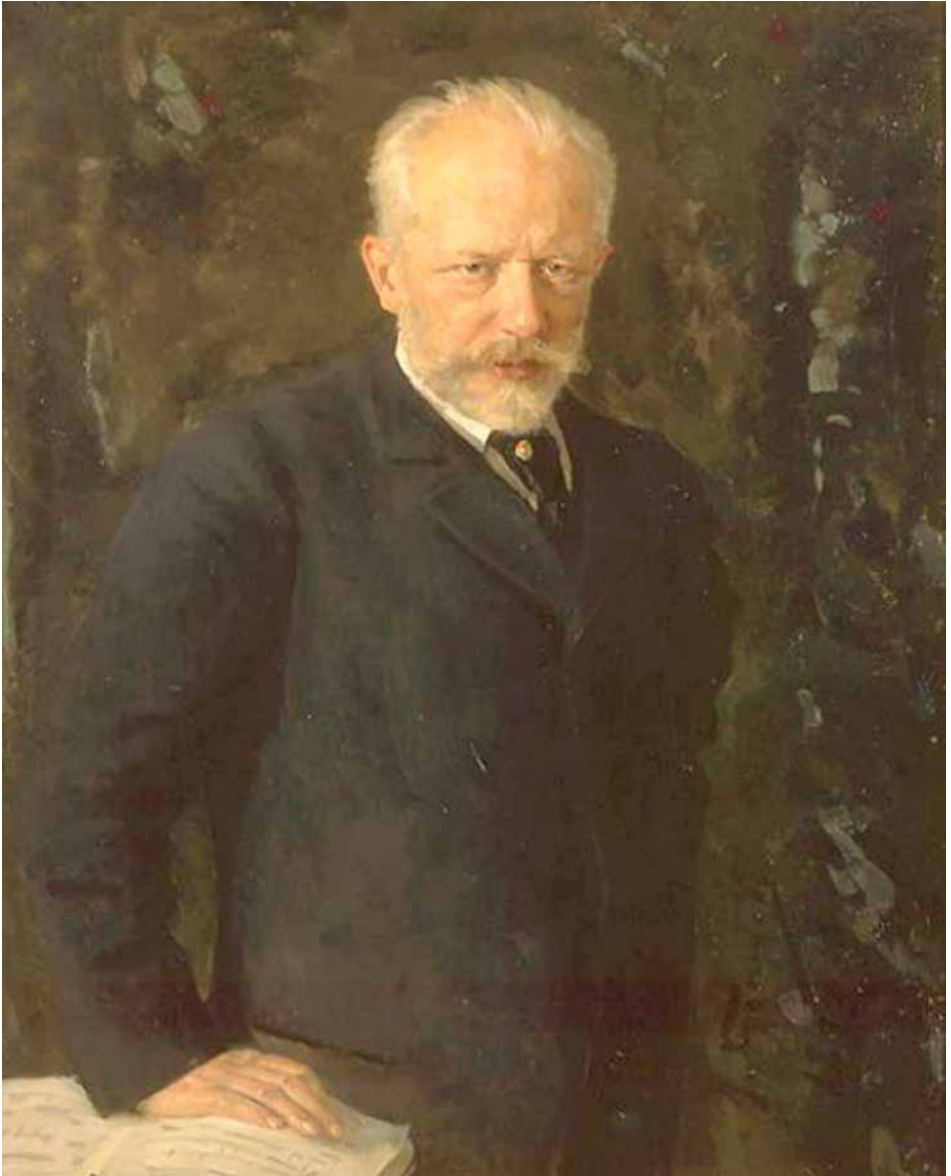
Piotr Ilich Chaikovski. Retrato de Nikolai Dimitriyevich Kuznetsov (1893. Óleo sobre lienzo)